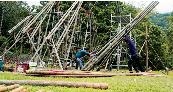
第四屆島嶼構竹作品《在若亭》使用竹材之防腐處理有台東專科學校木工科師生的竭力協助

第三、第四屆則更強化在地連結，由葉育鑫建築師擔任策展人，提出「島嶼構竹」概念，邀請更多非建築背景但長期耕耘自然建築的創作者